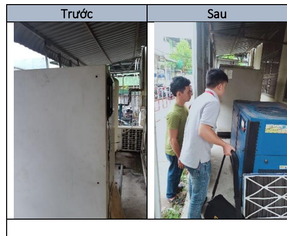
Hình ảnh trước và sau khi dời máy nén khí

Nhà máy đã thay thế máy nén khí trực vít ở Langham 2 bằng máy nén khí trực vít có VSD dời từ Langham 1 qua.