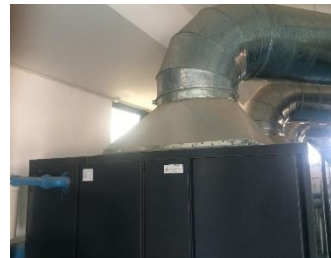
Hình sau cải tạo

Nhà máy đã nối liền ống xả khí nóng và máy nén khí khu B2.